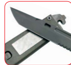
Pietra per riaffilare la lama Diamond stone for sharpening