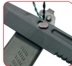
Piastra taglia fili Wire cutting plate

Nylon reinforced fibreglass with 440B stainless steel wire cutting plate MILSPEC coating. Diamond stone for sharpening on the back side, MOLLE compatible Cordura support.