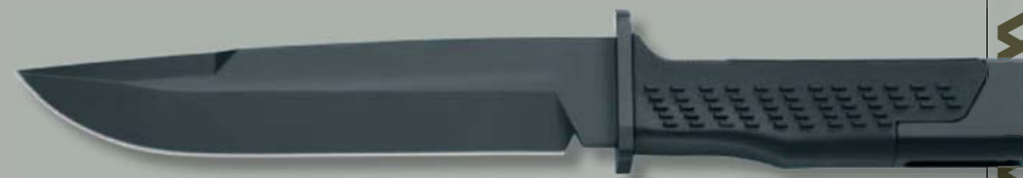
Art. SF-F2000 FN

lama - blade → Clip point → senza tagliafilili - without wire cutter spessore mm 6 - thickness 0.23" - peso 410 g - weight 14.10 oz